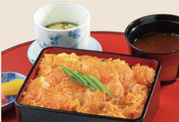
アグーヒレカツ重 2,000 円