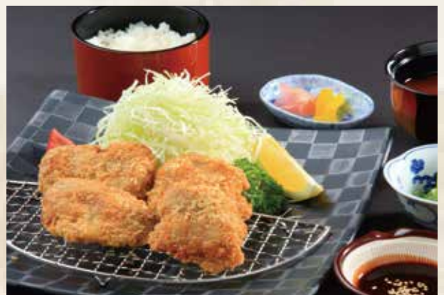
アグー豚ヒレカツ御膳 2,700 円