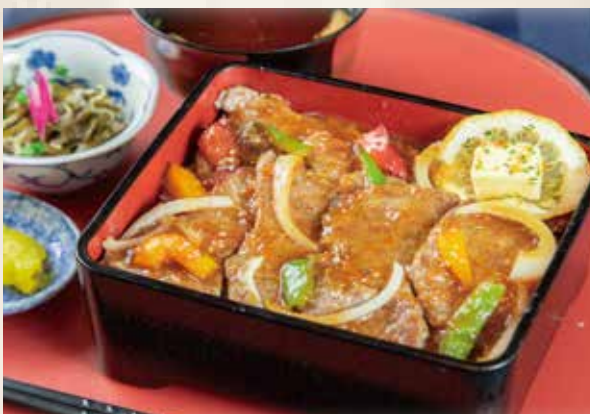
ステーキ重 2,000 円