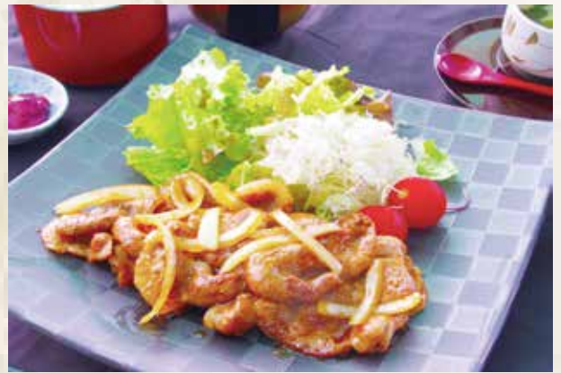
豚肉生姜焼き御膳 1,700 円