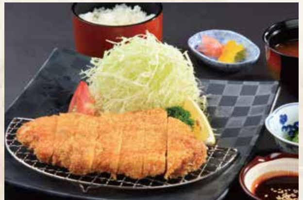
ローズカツ御膳 2,200 円